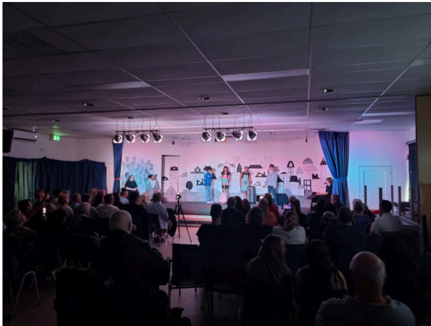
Musical/Afscheids-avond "Het land van niks".

Hier volgt alweer de laatste nieuwsbrief van het schooljaar. Een schooljaar dat werkelijk waar is omgevlogen. Aan het einde van het jaar is het tijd voor een terugblik. Afgelopen week hebben wij afscheid genomen van groep 8. De 10 kinderen hebben in de ochtend een mooie show neergezet en dat in de avond dunnetjes, met vrienden en familie over gedaan. Het was een feestje om daarbij te mogen zijn.